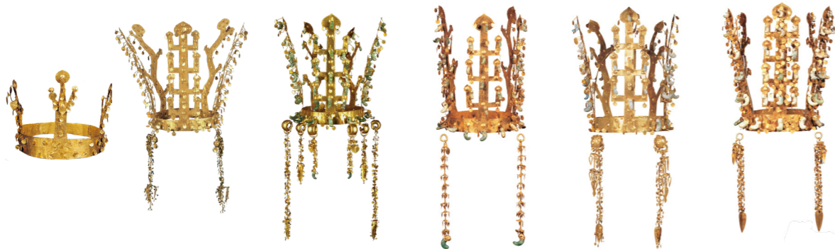
교동 금관 신라 5세기 높이 12.8cm 금령총 금관 신라 5~6세기 높이 27cm 보물 황남대총 금관 신라 5~6세기 높이 27.3cm 국보 금관총 금관 신라 5~6세기 높이 27.7cm 국보 서봉총 금관 신라 5~6세기 높이 30.7cm 국보 천마총 금관 신라 5~6세기 높이 32.5cm 국보

지금까지 발견된 신라 금관은 모두 6개입니다. 경주 교동에서 발견된 금관을 뺀 다섯 개의 금관은 신라의 마립간 시기에 만들어진 커다란 무덤 안에서 발견되었습니다.