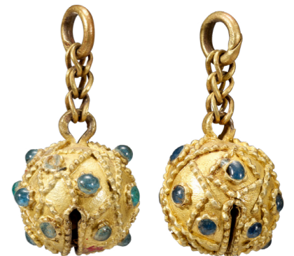
허리춤에서 발견한 금방울