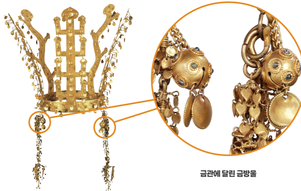
금관에 달린 금방울