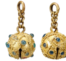
금령총 금방울 신라 5~6세기 / 지름 1.4cm * 주인공 허리춤에서 발견

한 쌍은 금관에 달려 있었고, 다른 한 쌍은 주인공의 허리춤에 있었어요.