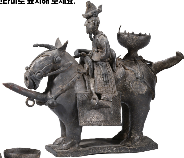
말 탄 사람 토기(주인상)