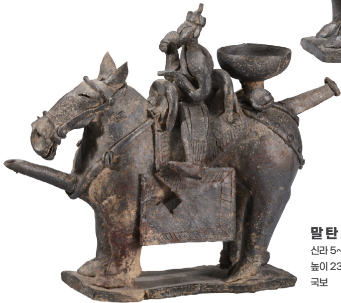
말 탄 사람 토기(하인상)