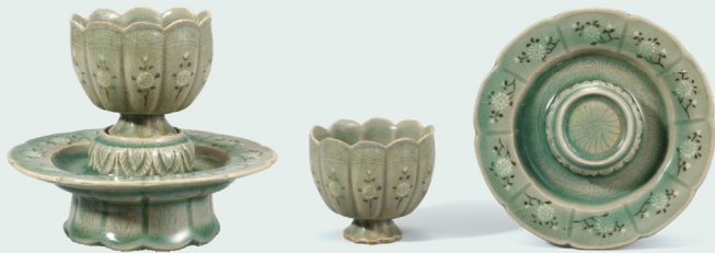
청자 상감 국화무늬 잔과 잔 받침