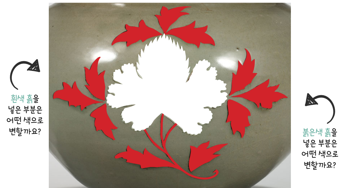
청자 상감 모란무늬 향아리

가마에 구우면 상감한 부분은 어떤 색으로 변할까요? 흰색과 붉은색을 긁어보세요.